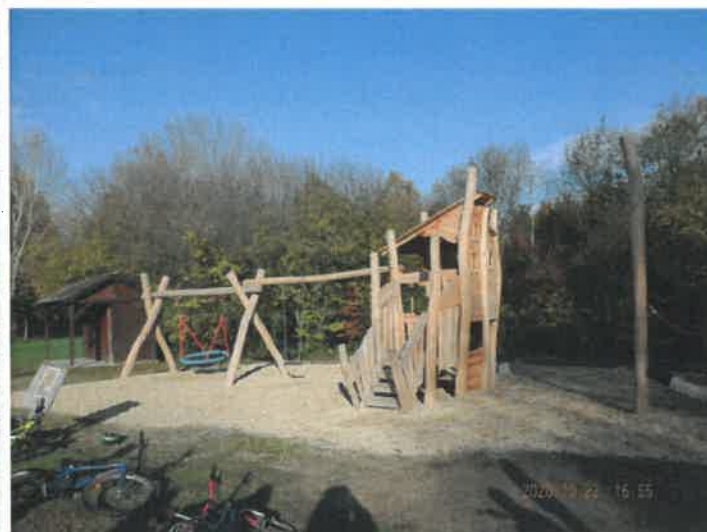
Une structure très complète et qui a belle allure!

Petit rappel: ces jeux sont destinés aux enfants. Les adolescents doivent respecter cette règle car même si l'on comprend qu'ils aient envie de les essayer, ils doivent faire attention à ne pas les détériorer et toujours laisser la place aux plus jeunes.