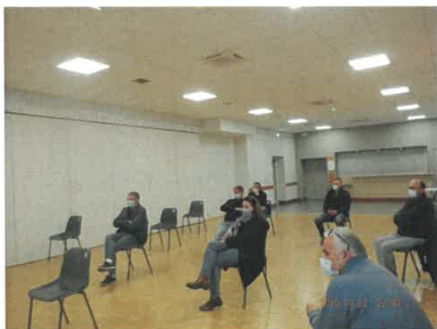
Une première rencontre avec les commerçants que la municipalité souhaite reconduire tout le long de son mandat.